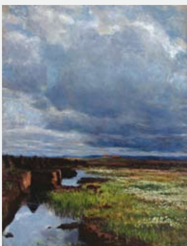
KITTY KIELLAND Torvmyr 1895