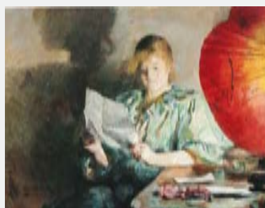
HARRIET BACKER Aften 1896

Asta Nørregaard (1853-1933) var mest kjent som en fremragende portrettmaler. Hun portretterte det fremvoksende borgerskap i Kristiania. I en lett idealiserende realisme foreviget hun elegante herrer, overklassedamer og veloppdragne barn. Til forargelse for flere menn innen kunstkretsen ble hun utropt til den største av de norske portrettmalerne. Teknisk dyktighet,