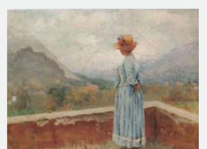
ASTA NØRREGAARD Kvinne på terrassen 1888