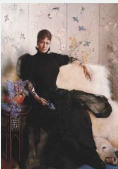
ASTA NØRREGAARD Elisabeth Fearnley 1892