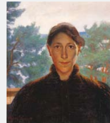
AGNES STEINEGER Selvportrett 1895