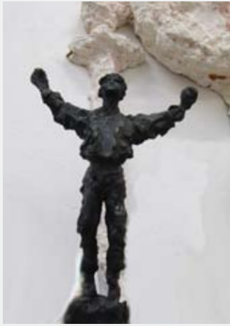
NINA SUNDBYE Peer Gynt