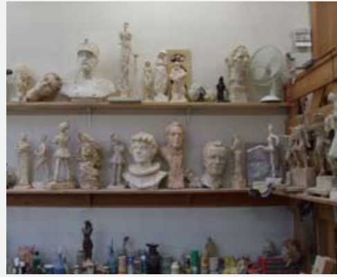
FOTOGRAFI FRA NINA SUNDBYES ATELIER