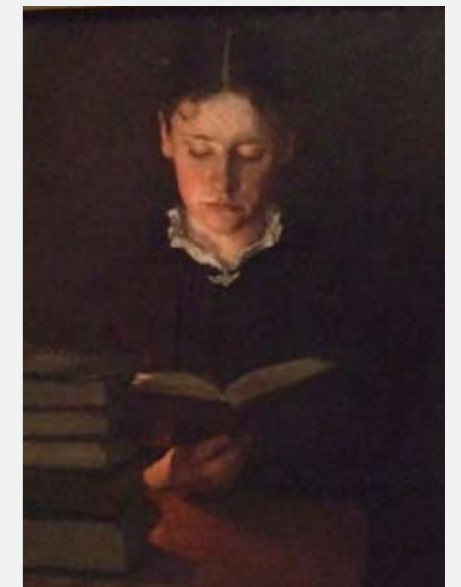
SIGNE SCHEEL Lesende pike 1896

Signe Scheel (1860-1942) malte ofte intime og svært gjennomarbeidede portretter av kvinnelige familiemedlemmer. De følsomme portrettene av mor eller søsken var ofte i små formater. Scheel mente at « .. man maler best dem man kjenner og er glad i.» Scheel var syk store deler av sitt liv og dessuten svært selvkritisk. Derfor ble hennes produksjon svært beskjeden. Hennes bilder har en sjelden nærhet og er av en svært høy kvalitet.