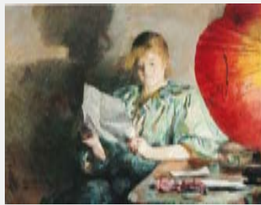
HARRIET BACKER Aften 1896

Asta Nørregaard (1853-1933) var mest kjent som en fremragende portrettmaler. Hun portretterte det fremvoksende borgerskap i Kristiania. I en lett idealiserende realisme foreviget hun elegante herrer, overklassedamer og veloppdragne barn. Til forargelse for flere menn innen kunstkretsen ble hun utropt til den største av de norske portrettmalerne. Teknisk dyktighet,