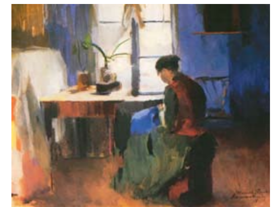
HARRIET BACKER Kone som syr 1890