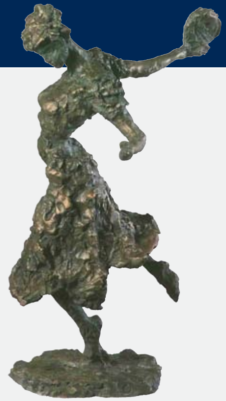
NINA SUNDBYE Nora danser

Blaafarveværket 19. mai – 23. september 2012