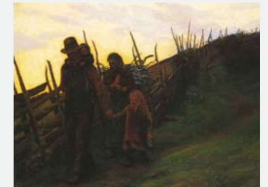
MARIE HAUGE Husmannsfolk 1896

Marie Hauge (1864-1931) hentet flere av sine motiver fra Gudbrandsdalen hvor hun tilbrakte sine somre. I en nyromantisk stil malte hun litt sentimentale bilder som skildret norsk folkekultur. Her finner vi gårdstun, husmenn og bondelivets slit, gjerne omgitt av en skumrende aftenstemning. Portretter var også Hauges spesialitet og hun foreviget flere av landets kulturpersonligheter.