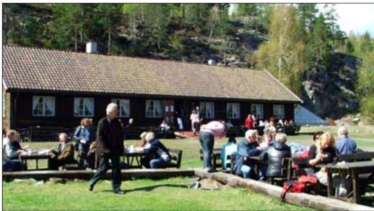
Gruvetrækka med Gruvekroa.