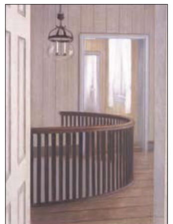
Ida Lorentzen: Fra Nyfossum, 2002