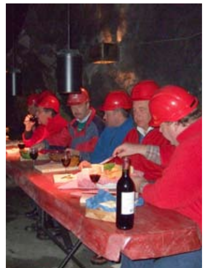
Ost og drikke i Bergknappen.