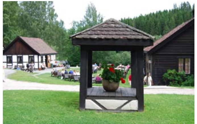
Idylliske omgivelser på Blaafarvverket.