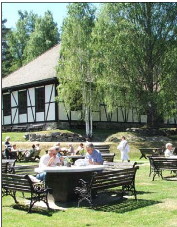
Blaafarvewærket — tradisjon og kvalitet