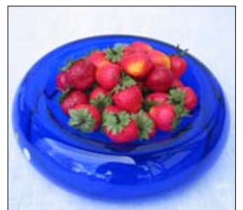
Glass fra «Den Blå Butikk»