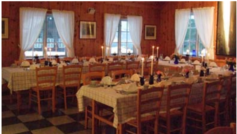
God stemning i Gruvekroa.

Vi skreddersyr turer og spesialarrangementer. På Koboltgruvene kan vi kombinere spennende opplevelser med nydelig hjemmelaget mat i historiske omgivelser.