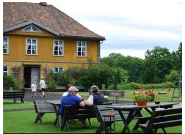
Direktørboligen og hagen på Nyfossum