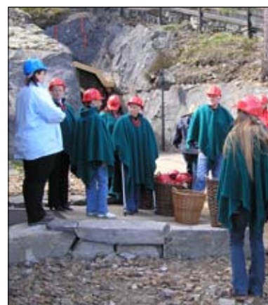
Klar for gruvetur.