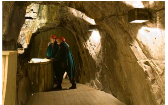
Det er plankegulv i hele gruva, godt tilrettelagt for alle.