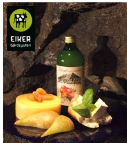
Gruveosten er laget av Eiker Gårdsysteri og modnet inne i gruvene.