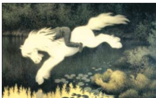
Th. Kittelsen: Nøgken som hvit hest, 1909.

Gruvekroa er et naturlig samlingspunkt på Koboltgruvene. Her serverer vi vår hjemmelagde mat til 15-100 mennesker i den hyggelige kroa. Gruvebutikken er utgangspunktet for gruveturene og har et variert utvalg av suvenirer.