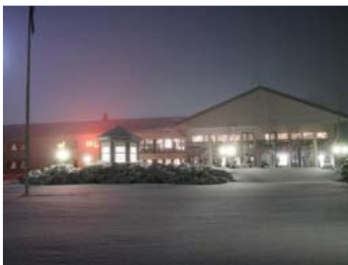
Tyrifjord hotell i vinterdrakt

Rikholdig frokostbuffet på hotellet. Barnas gruvetur på Koboltgruvene til location for kinofilmen Blåfjell 2. Hjemmelaget mat i gruvekroa.