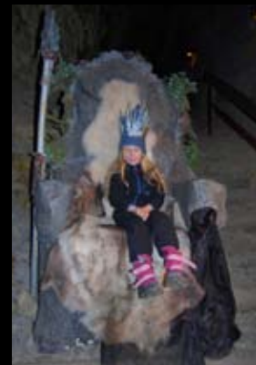
Prøv Dronning Fjellroses trone