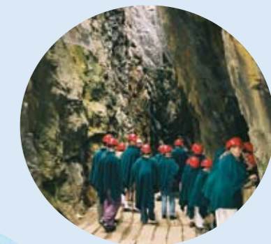
THE COBALT MINES

Et 8 km langt museum med opplevelser for alle sanser