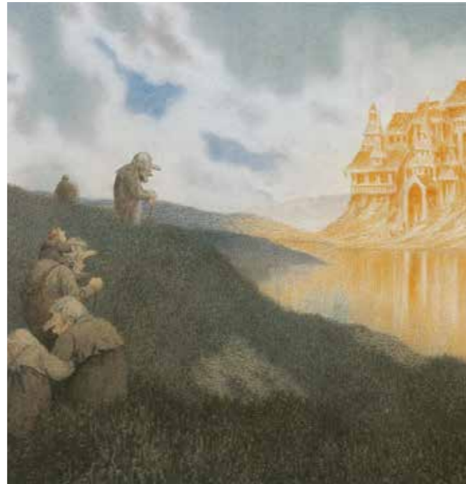
Detall fra "På veien til glide", Theodor Kittelsen