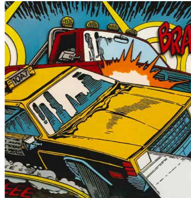
Detall fra "Car crash", Eivind Blaker