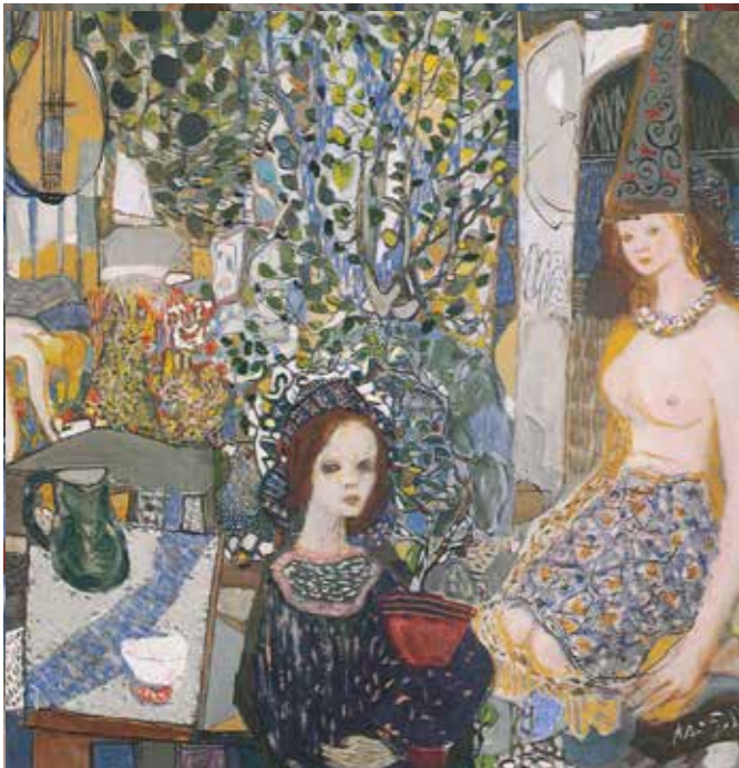
Detall fra "Studie", 1939, Kai Fjell